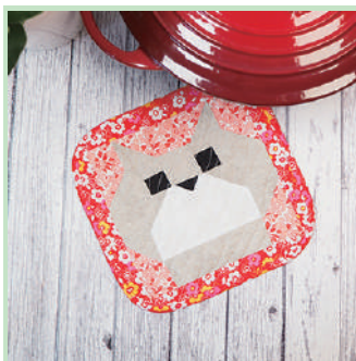
Manique au design de petit chat