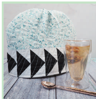
Couvre-théière au motif d'oies en plein vol